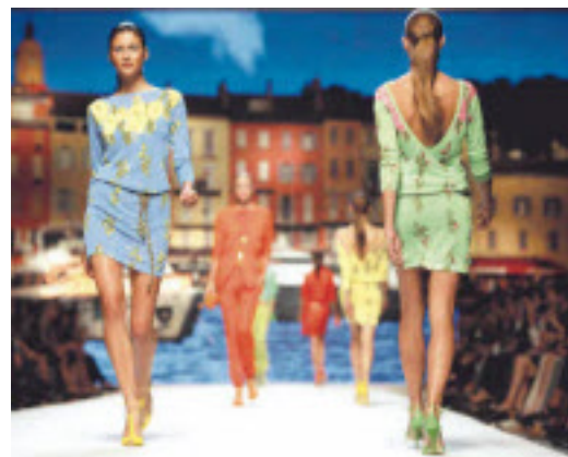
Modelmaß: Spiegel einer größer werdenden Menschheit