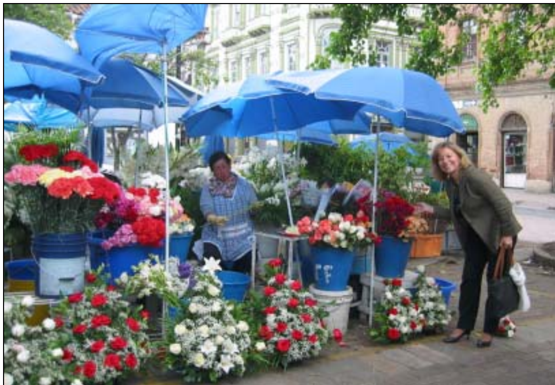
At the flower market – Cuenca, Ecuador - ICOFOM/ICOFOM LAM 2002