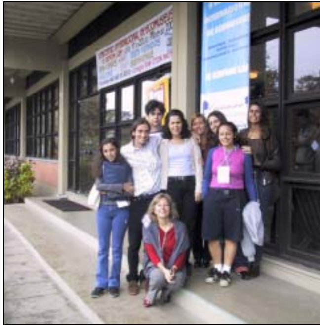
With students of the School of Museology – Santa Cruz, RJ II International Seminar on Ecomuseums / ICOFOM LAM / MINOM 2000