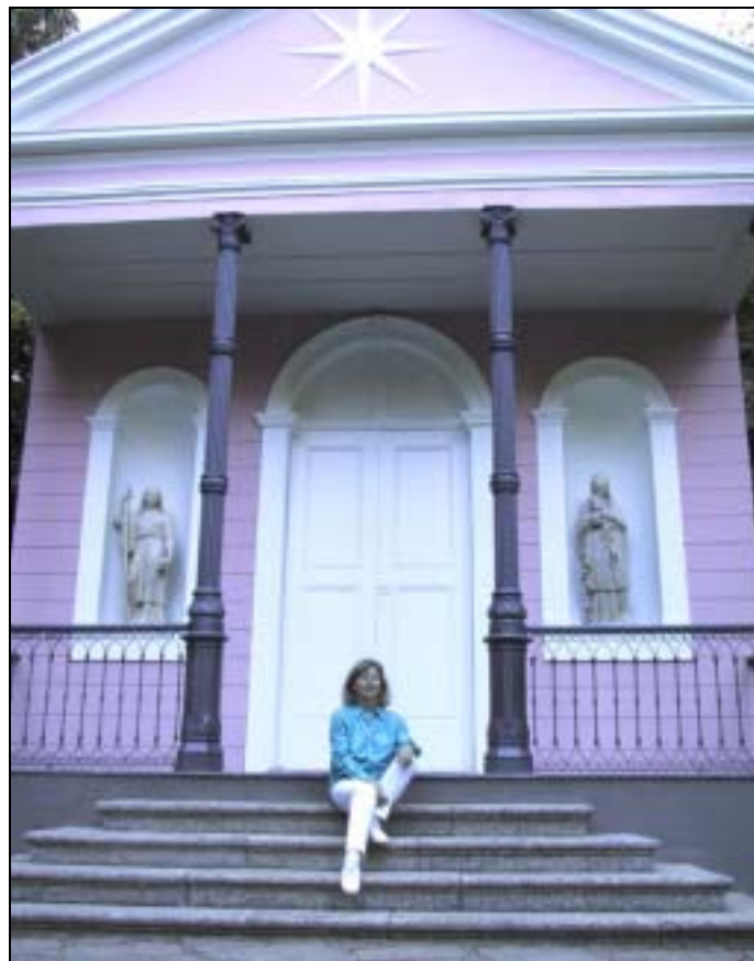
Mayrink Chapel, National Park of Tijuca – Rio de Janeiro, Brazil (National Heritage Site and Reserve of Biosphere)