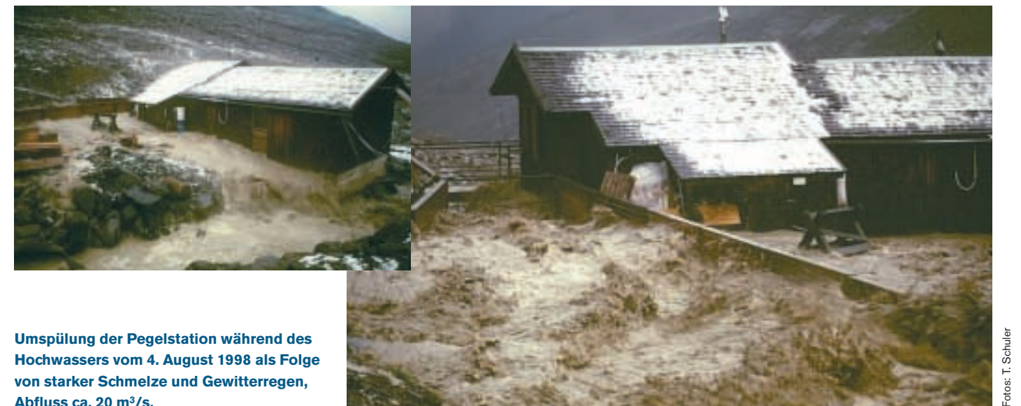
Umspülung der Pegelstation während des Hochwassers vom 4. August 1998 als Folge von starker Schmelze und Gewitterregen, Abfluss ca. 20 m³/s.

Die Forschungsarbeiten der Kommission für Glaziologie beschränken sich nicht auf den Vernagtferner. In Zusammenarbeit mit anderen Forschungsinstitutionen wird zur Zeit auch am neuen Gletscherkataster für ganz Österreich und Südtirol mitgewirkt, es werden die Folgen des Klimawandels auf das Einzugsgebiet des Inns abgeschätzt und der Einfluss des weltweit beobachteten Gletscherrückgangs auf die Wasserspenden zentralasiatischer Gebiete untersucht. Dort stellt das von den Gletschern stammende Schmelzwasser die kostbarste Süßwasserressource dar.