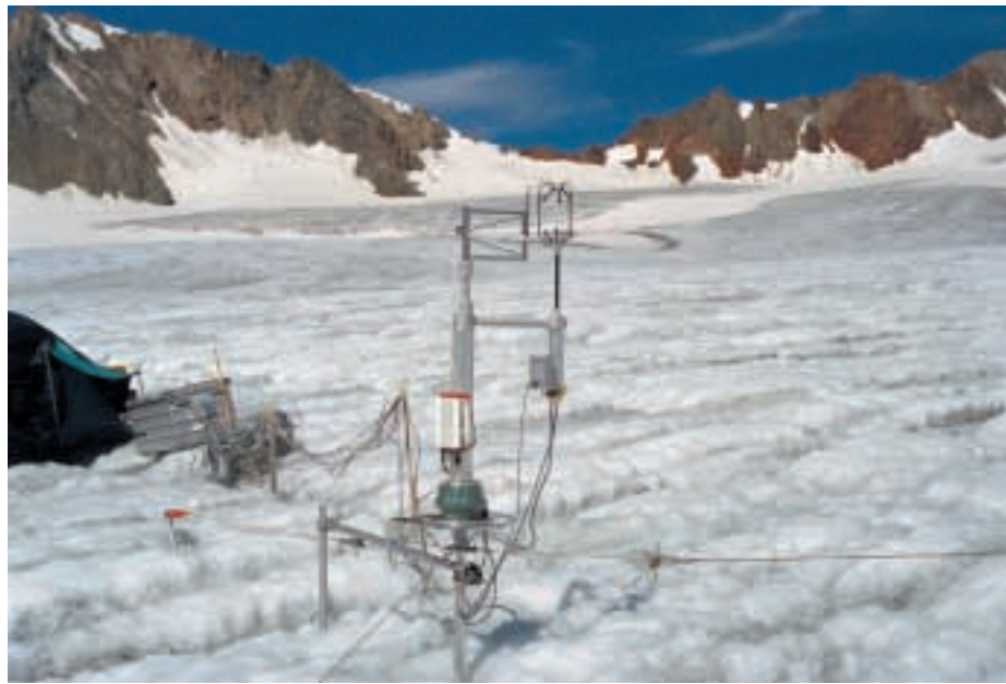
Apparatur zur Messung von Windgeschwindigkeit, Temperatur und Feuchte mit bis zu 60 Messungen pro Sekunde, HyMEX2000 August 2000, im Hintergrund das Taschachjoch (3235 m)

Von elementarer Bedeutung bleiben die Forschungsarbeiten am Vernagtferner, zumindest solange er existiert, was trotz der schlechten Prognosen noch gut 100 Jahre dauern dürfte. Damit auch in Zukunft bei erhöhten Abflussspitzen die Messungen an der Pegelstation Vernagtbach zuverlässig weitergeführt werden können, musste die Messanlage in den Jahren 1995 und 2000 unter beträchtlichem finanziellen Aufwand saniert werden, was dank der Unterstützung durch die Karl Thiemig-Stiftung München und den DAV möglich wurde, der gleichzeitig Sanierungsarbeiten am Weg zur Vernagthütte