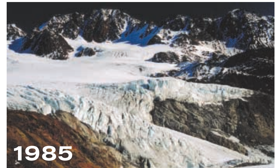
Vergleich der Ansicht des Vernagtferners 1985 mit 2000: Blick von der Schwarzwandzunge zum Vorderen Brochkogel (3565 m). Die gesamten Eismassen im Vordergrund sind verschwunden. Der Aufnahmestandpunkt von 2000 liegt deutlich tiefer als 1985, weil hier die orographisch linke Seite der Schwarzwandzunge abgeschmolzen ist.